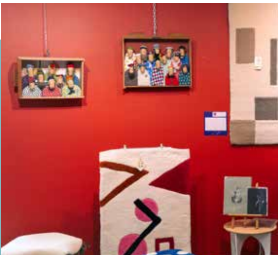
CADEAUX D'ART - 2023

Année de création de la Vitrine des Métiers d'Art et des nouveaux locaux de l'Office de tourisme