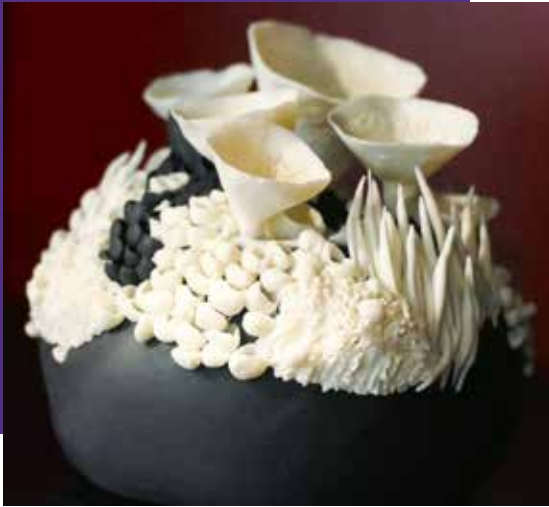
CÉRAMIQUE - 2024

Situé à Villedieu-les-Poêles en Normandie, l'Office de tourisme de Villedieu Intercom dispose d'un espace dédié à l'artisanat : la vitrine des métiers d'art. Ce projet naît de l'impulsion d'une politique de développement des métiers d'art par l'intercommunalité. L'objectif est de profiter de ce lieu fréquenté pour promouvoir et valoriser l'artisanat d'art à Villedieu-les-Poêles, labellisée Ville et Métiers d'Art ; et ainsi en faire un tiers-lieu du patrimoine vivant.