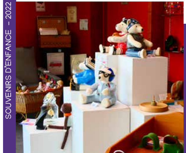
SOUVENIRS D'ENFANCE - 2022