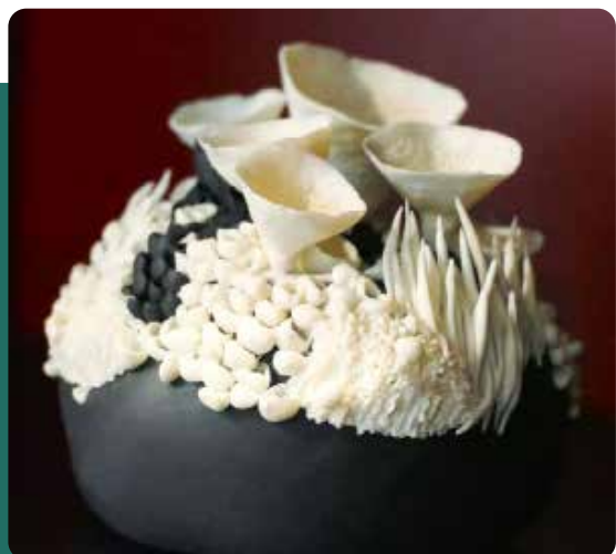
CÉRAMIQUE – 2024

Année de création de la Vitrine des Métiers d'Art et des nouveaux locaux de l'Office de tourisme