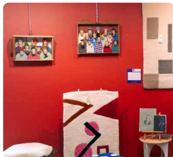
CADEAUX D'ART – 2023